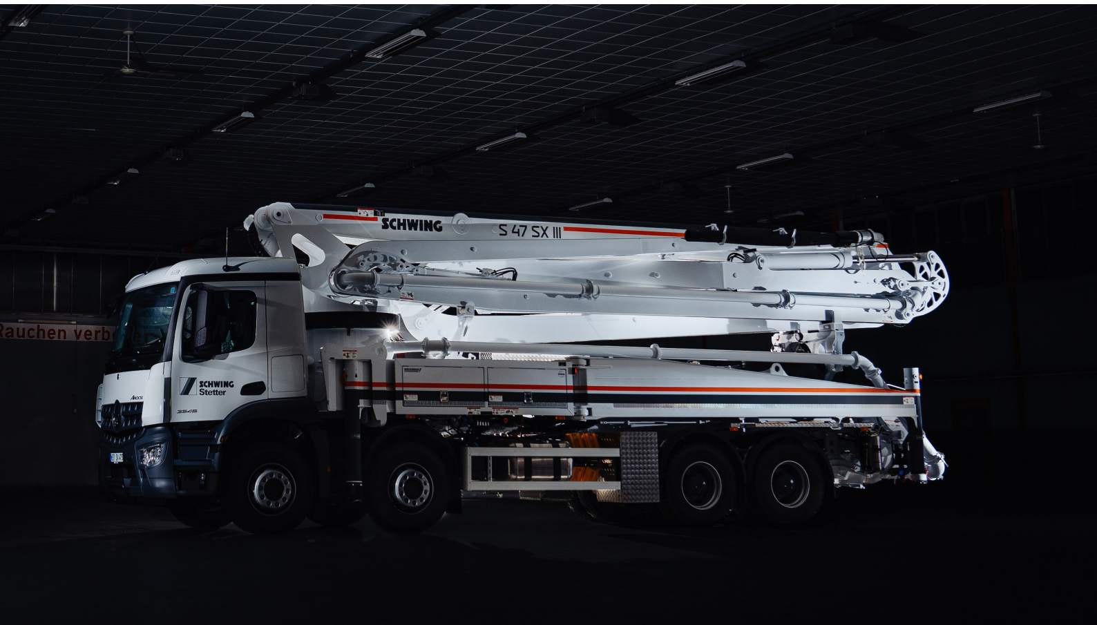
Autobetonpumpe S 47 SX III SCHWING GmbH, Herne | Dreharbeiten und fotografisches Konzept