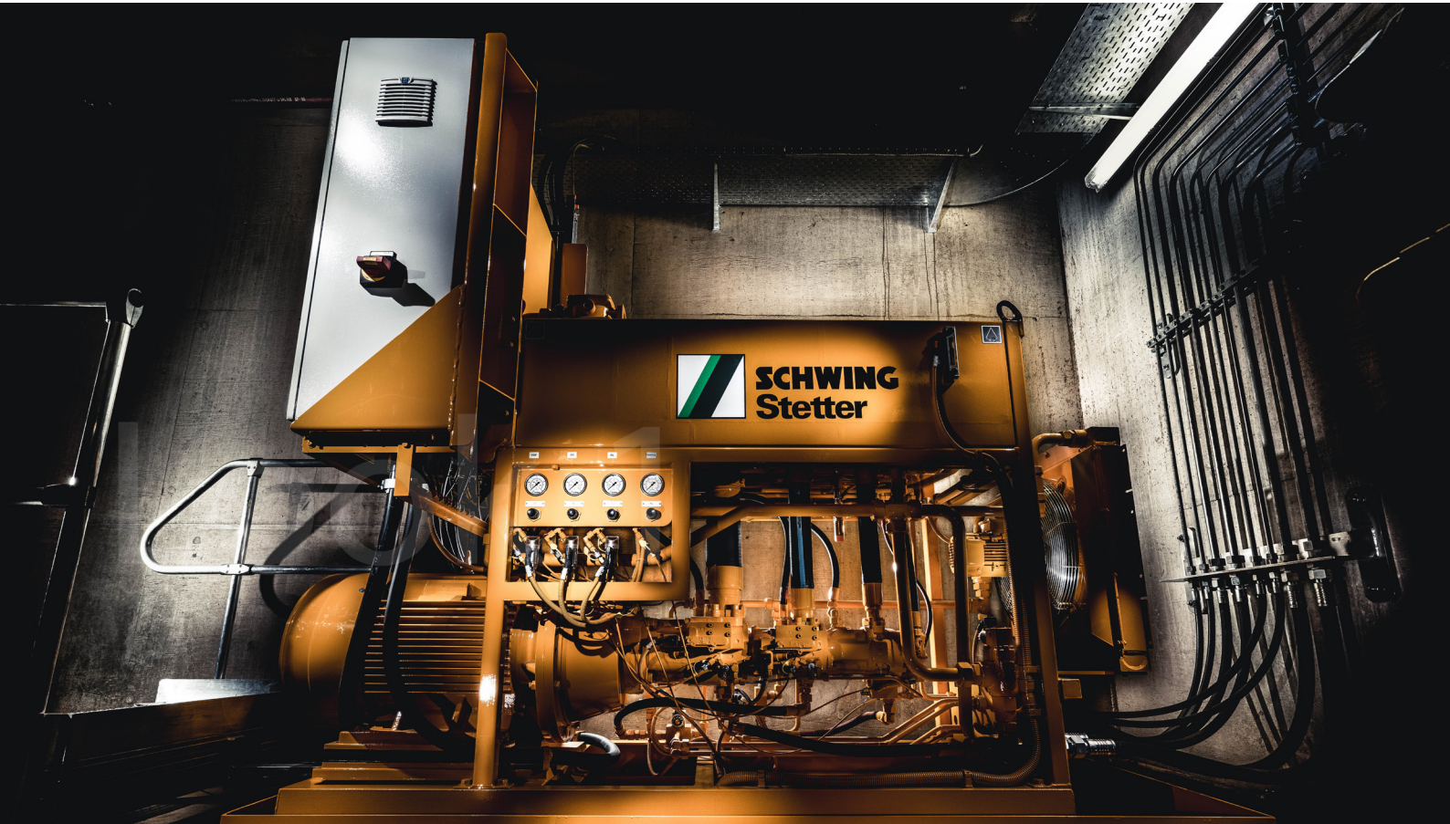
Kampagnen fotografie Dickstoffpumpe SCHWING GmbH, Herne